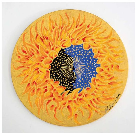
「Sunflower」2023年、麻包張キャンバスにアクリル絵具、Φ530mm