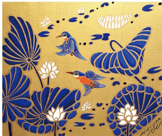
「Kingfisher by the Lotus pond」2022年、麻包張キャンバスにアクリル絵具、606×727mm